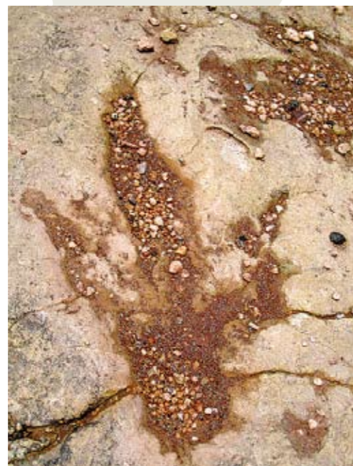
עקבות דינוזאורים. נכראה נבהלו מטורף גדול, שינו כיוון ונסו

אינטרנט: www.eno.org/see-whats-on/productions/production-page.php?itemid=1664