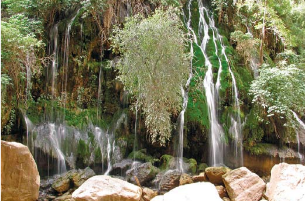
מפל El Vergel. מקלחת של עוצמה ושל יופי