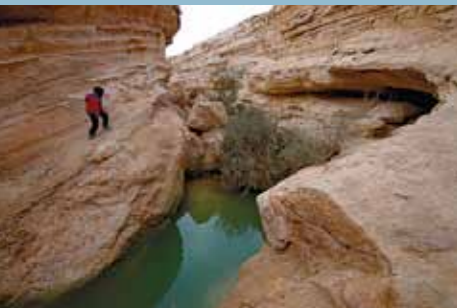
נחל קרקש. הליכה עם הרבה קסם